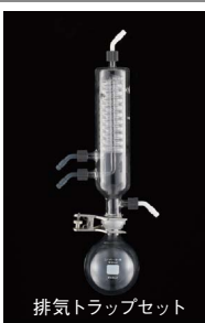
排気トラップセット

※NVC-3000型でポンプをコントロールするためには別売りのポンプコントロールボックス PBX型と制御用電磁弁CV-11・12型が必要です。