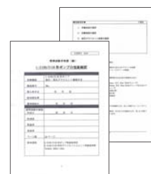
例) 標準試験手順書